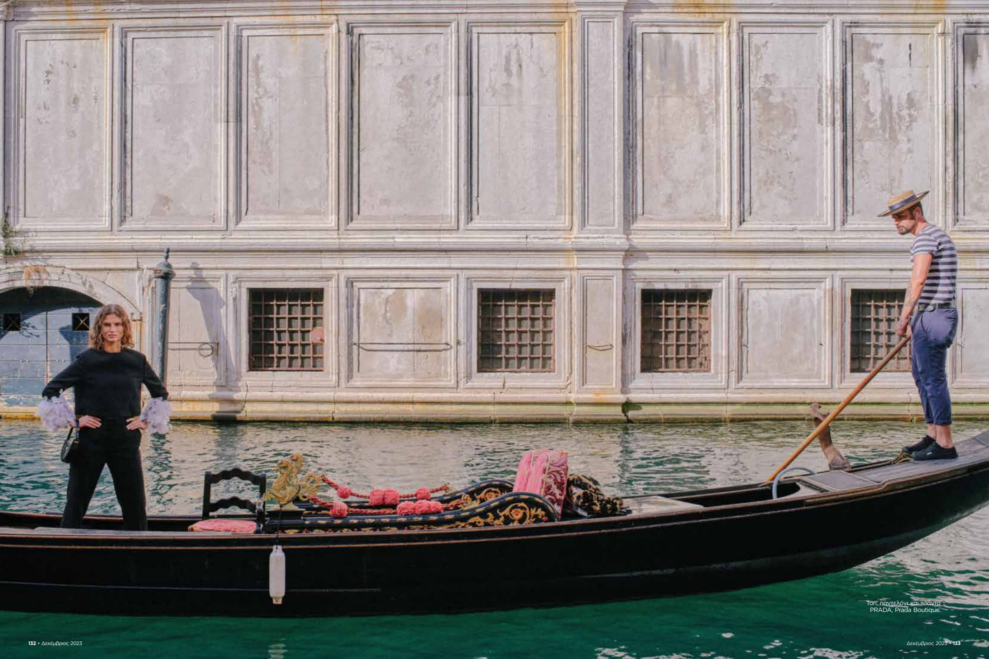
Τοπ, παντελόνι και τσάντα PRADA, Prada Boutique.