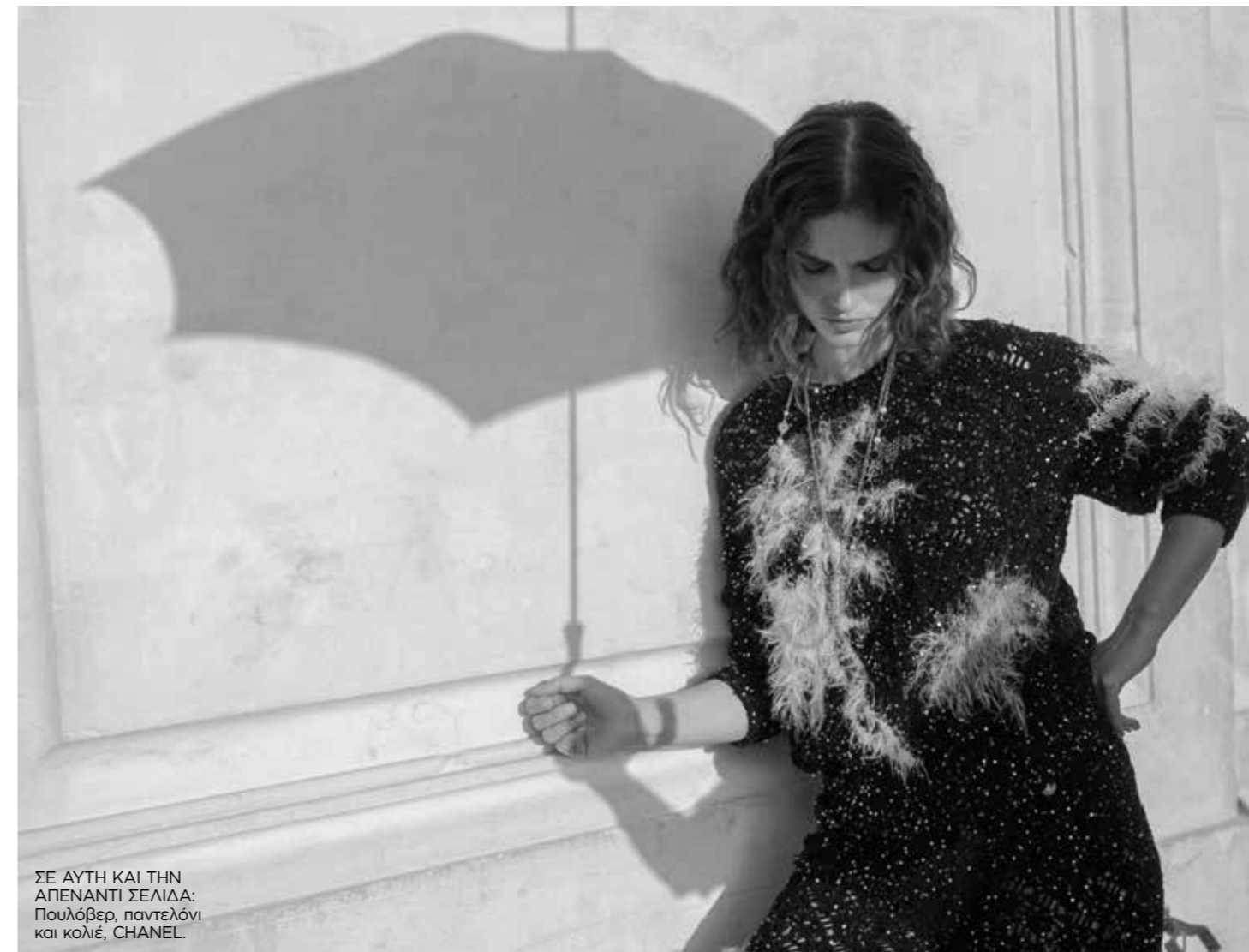
ΣΕ ΑΥΤΗ ΚΑΙ ΤΗΝ ΑΠΕΝΑΝΤΙ ΣΕΛΙΔΑ: Πουλόβερ, παντελόνι και κολιέ, CHANEL.