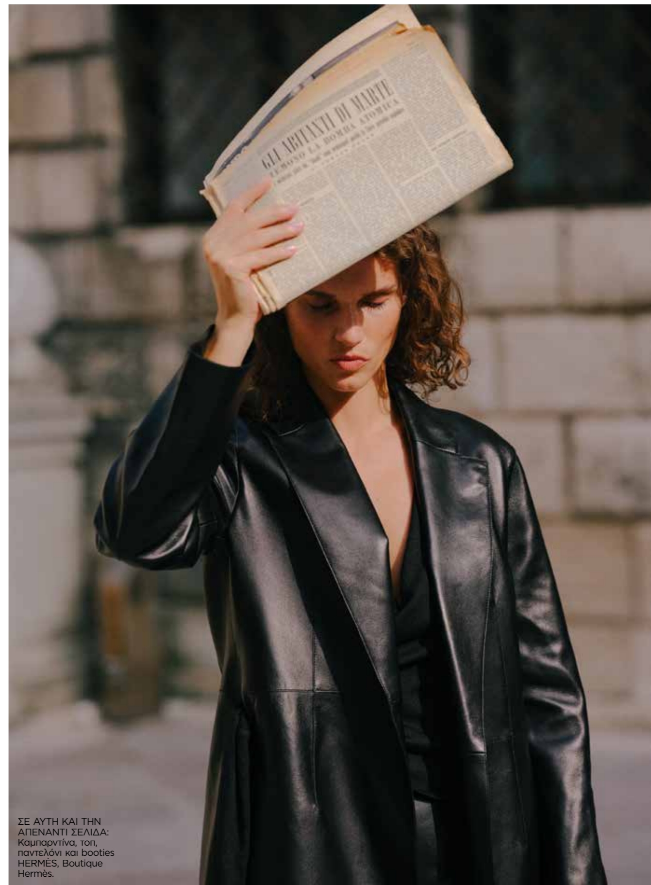
ΣΕ ΑΥΤΗ ΚΑΙ ΤΗΝ ΑΠΕΝΑΝΤΙ ΣΕΛΙΔΑ: Καρμπαρντίνα, τοπ, παντελόνι και booties HERMÈS, Boutique Hermès.