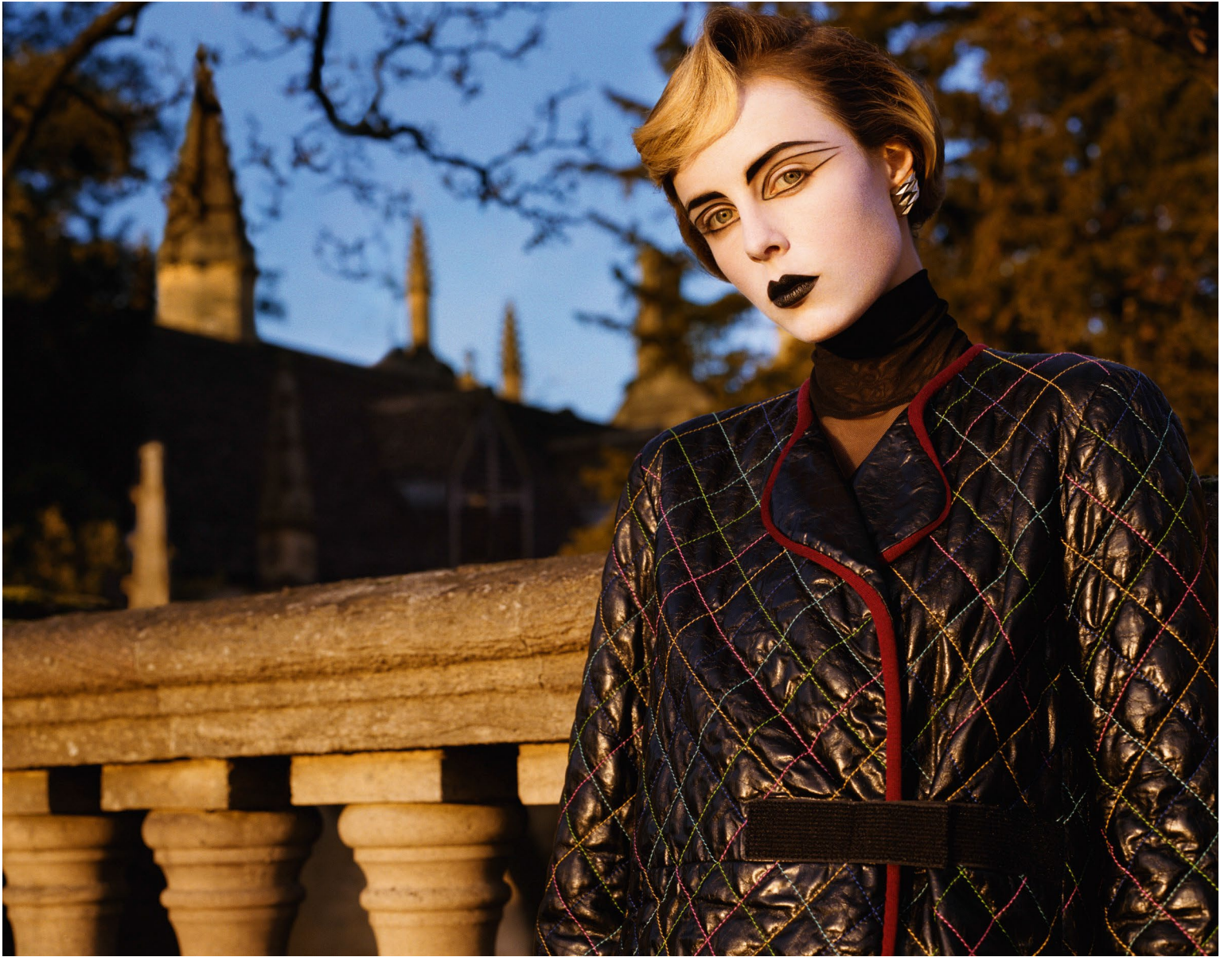
Manteau en cuir surpiqué et gansé de jersey, Chanel. Col roulé en tulle transparent, Wolford. Boucle d'oreille en or blanc, Vhernier. PAGE DE DROITE, robe en tulle brodé de sequins, Michael Kors Collection. Boucle d'oreille en métal doré, Valois Vintage. Collants Wolford.