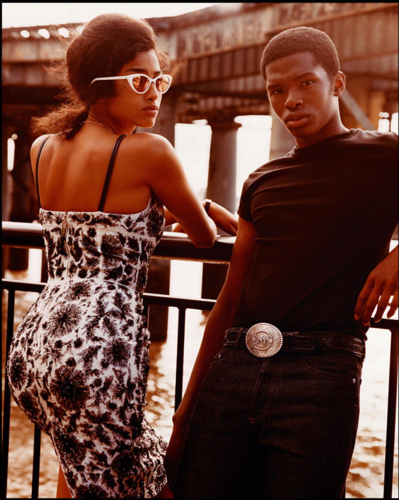
41 KODAK PORTRA 400