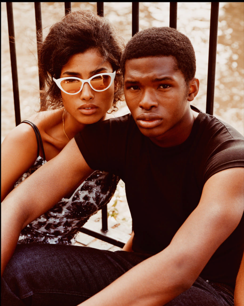
42 KODAK PORTRA 400